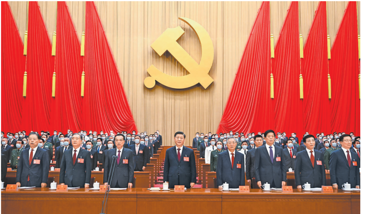
10月16日,中国共产党第二十次全国代表大会在北京人民大会堂开幕。习近平代表第十九届中央委员会向大会作报告。