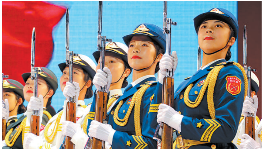
执行仪仗任务。