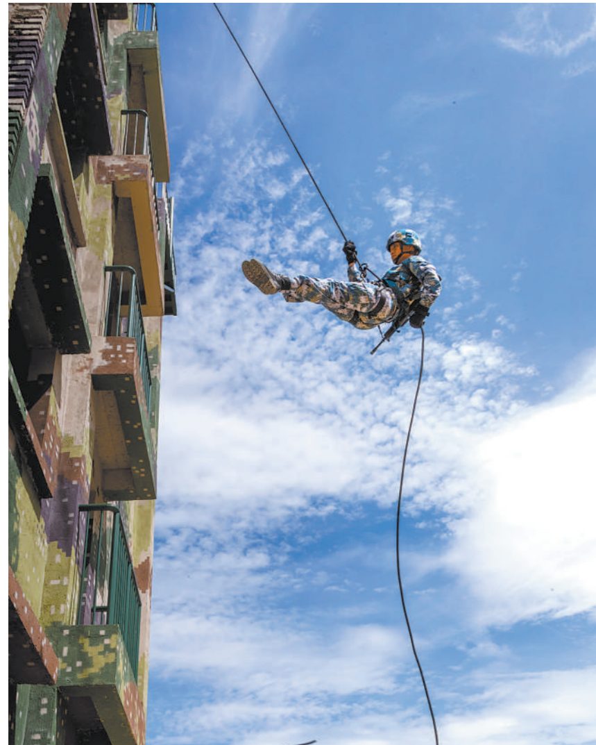
6月3日，海军陆战队某部组织城市作战演练。

党史学习教育开展以来，该旅把学习教育成果转化工作动力，飞行员们苦练精飞，多次圆满完成重大战训任务，部队战斗力稳步提升。