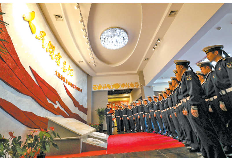
北部战区海军航空兵某团组织官兵来到驻地烈士纪念馆，教育引导官兵将爱国情怀和强军信念融入岗位实践，苦练打赢本领。