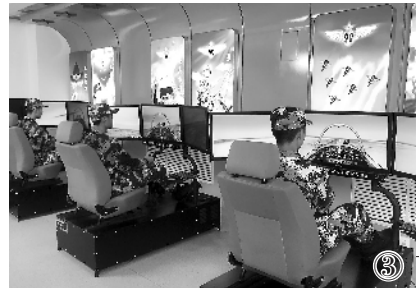
图①:航空实验班学生赴空军航空大学参加体验飞行。图②:航空实验班学生安装航模。图③:航空实验班学生进行模拟飞行训练。

成需要,超前培育军事航空领域新型飞行人才。原总政治部与教育部、公安部联合印发《空军青少年航空学校建设实施办法》,为学校建设提供了基本依据。