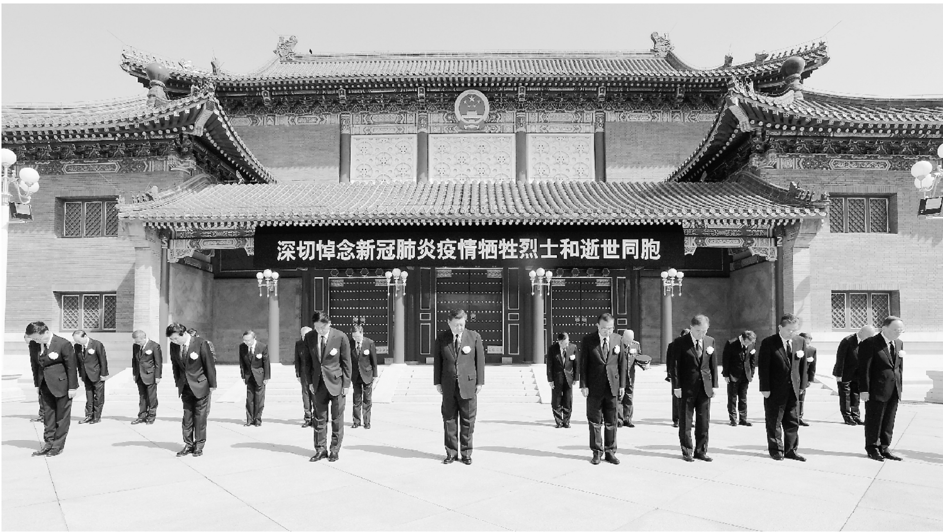
4月4日上午10时,习近平、李克强、栗战书、汪洋、王沪宁、赵乐际、韩正、王岐山等党和国家领导人在中南海怀仁堂前,同全国各地各族人民一起,向抗击新冠肺炎疫情斗争牺牲烈士和逝世同胞默哀。