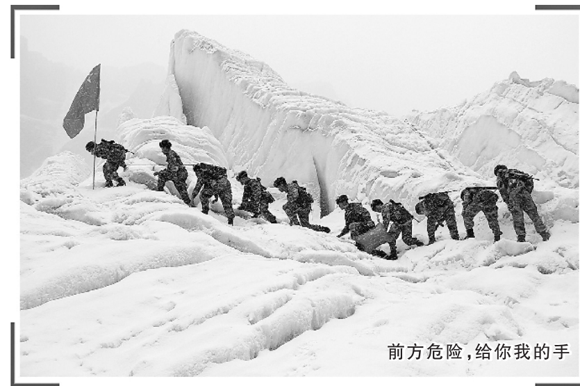
前方危险，给你我的手