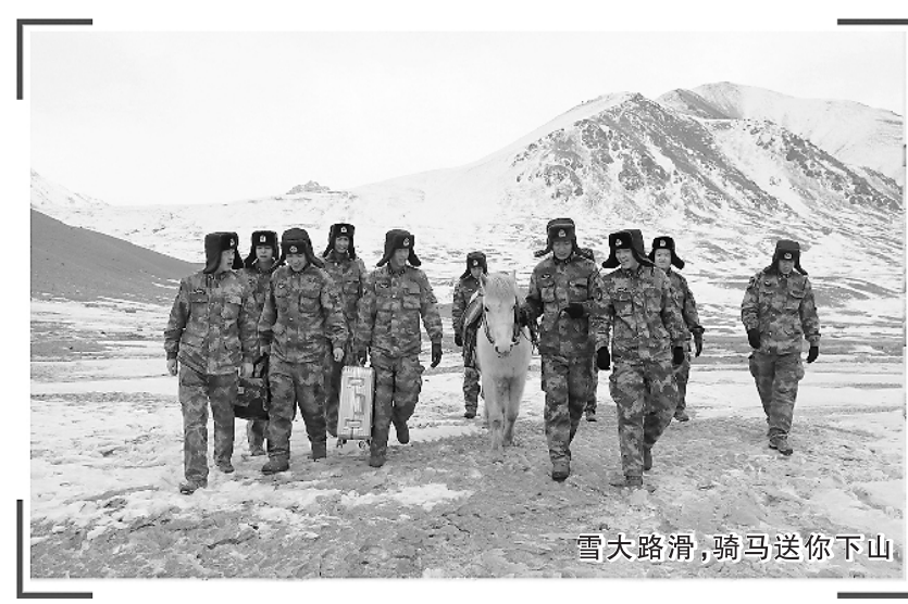
雪大路滑，骑马送你下山